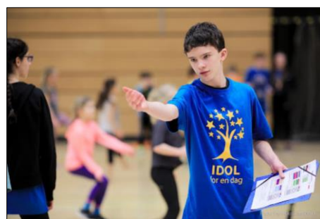
Elever i 6.klasse coacher elever i 1.klasse i kidsvolley.